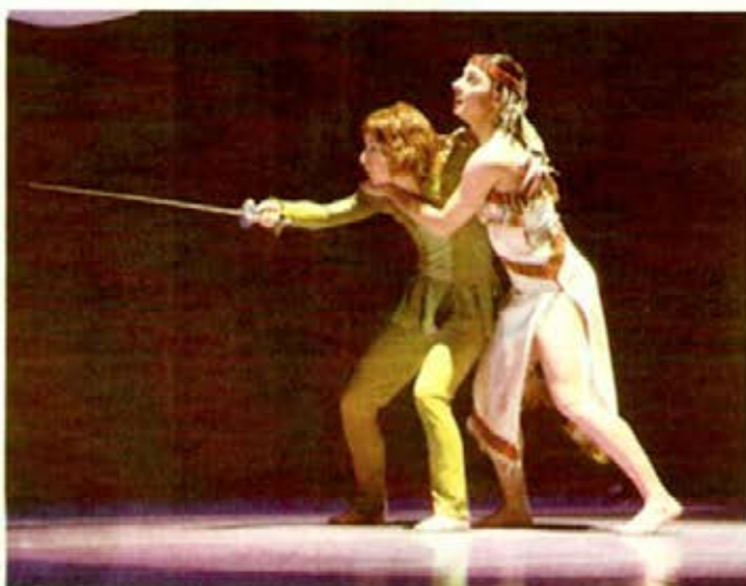
Ananda Dansa clausuró Feten en el Jovellanos.