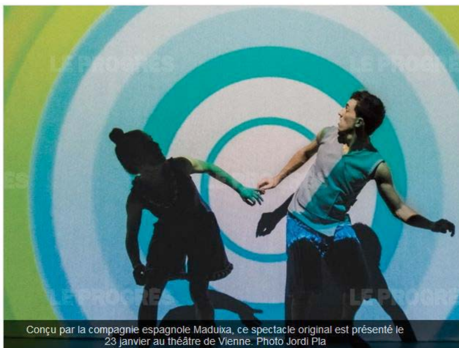
Conçu par la compagnie espagnole Maduixa, ce spectacle original est présenté le 23 janvier au théâtre de Vienne.

Un spectacle de 45 minutes d'après les travaux du plasticien Sol Lewitt.