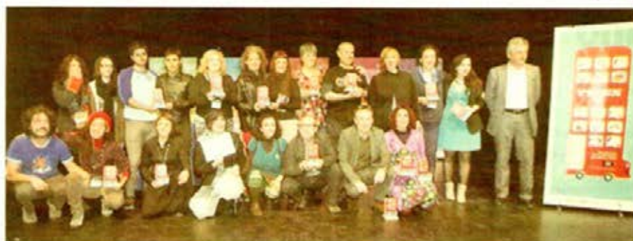
Foto de familia de premiados y quienes entregaron los galardones de la Feria Europea de Artes Escénicas para Niños y Niñas. SEVILLA