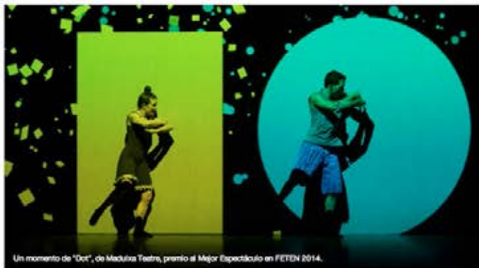
Un momento de 'Dot', de Maduixa Teatre, premio al Mejor Espectáculo en FETEN 2014.

La compañía valenciana corona un palmarés en el que brillan también La Rous, con tres premios, y Marie de Jongh, con dos // La compañía asturiana Tras la Puerta Titeres, premio al Mejor Texto adaptado, y la astur-búlgara Teatro Plus, Mención Especial del Jurado