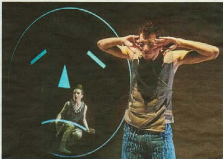
Maduixa va estrenar «Dot» el passat més de novembre a Sueca. LEVANTE-EMV

Precisament, ara Maduixa es troba en plena gira per França amb «Ras!», muntatge que també va ser reconegut amb el premi Feten del jurat en 2010. La companyia ja ha realitzat més de 600 representacions amb aquest espectacle a diferents llocs d'Espanya, França,