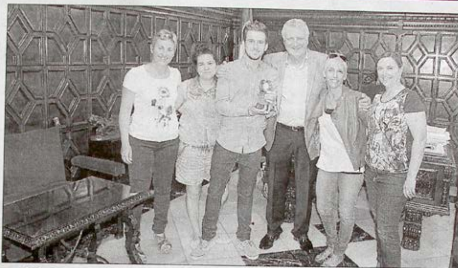
Recibimiento a la compañía, ayer, en el consistorio.