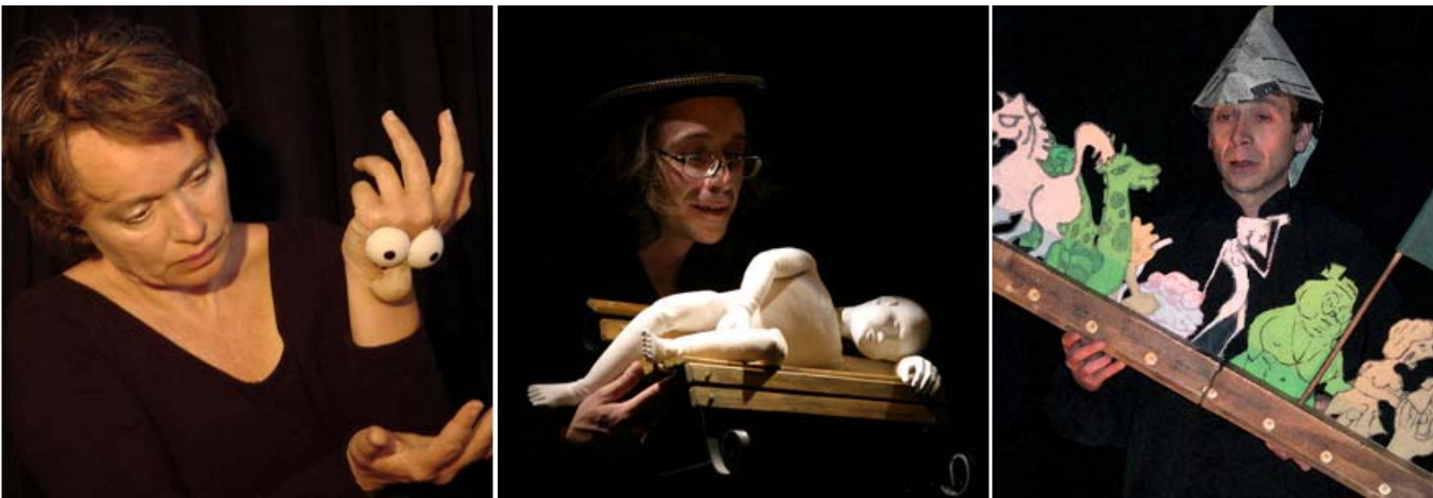
Imágenes de Cuentos pequeños 2 , Entre diluvios y Vulgarcito , los tres espectáculos que visitaron el Corral en 2012 dentro de la primera edición de Titirimundi en el Corral

Segovia se ha convertido en estos años en la ciudad de los títeres por excelencia, y tiene cada vez más extensiones por todo el territorio nacional. Una edición más, la ciudad de Alcalá de Henares también se une a la gran fiesta de Titirimundi con la programación de tres espectáculos distintos y para todos los públicos, tanto niños como adultos.